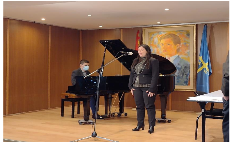
Una de las actuaciones del Festival

El pasado día 27 de noviembre, DinamicMúsica, como asociación que tiene como objetivo fundamental fomentar la música como elemento inclusivo de participación social, celebró su primer Festival Internacional de Otoño "Joaquín Rodrigo".