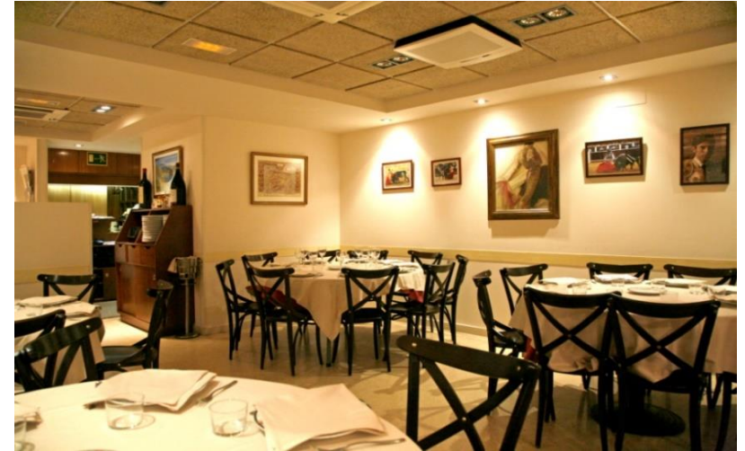
Casa Hortensia – Restaurante ESPECIALIZADO EN COMIDA ASTURIANA

LOS TRABAJOS PARA LA REVISTA DE FEBRERO DEBEN ENVIARSE ANTES DEL 15 DE ENERO