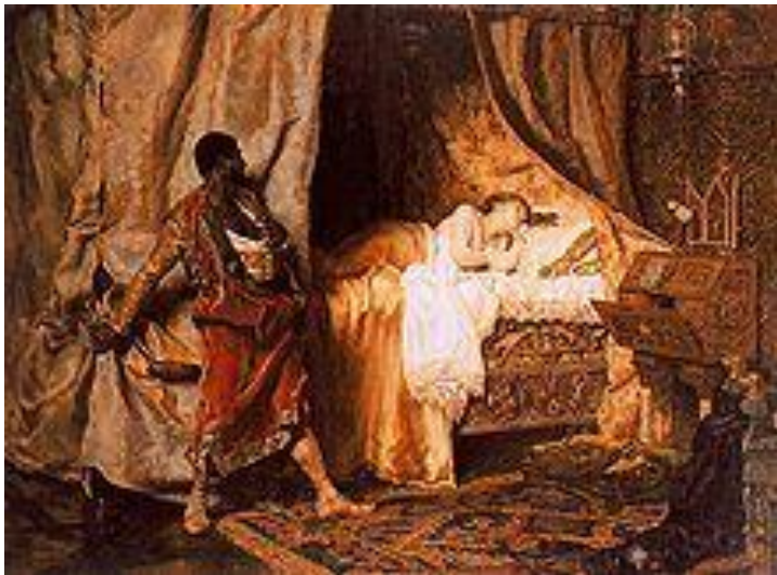
Otelo y Desdémona, por Muñoz Degraín. Pintura de 1881