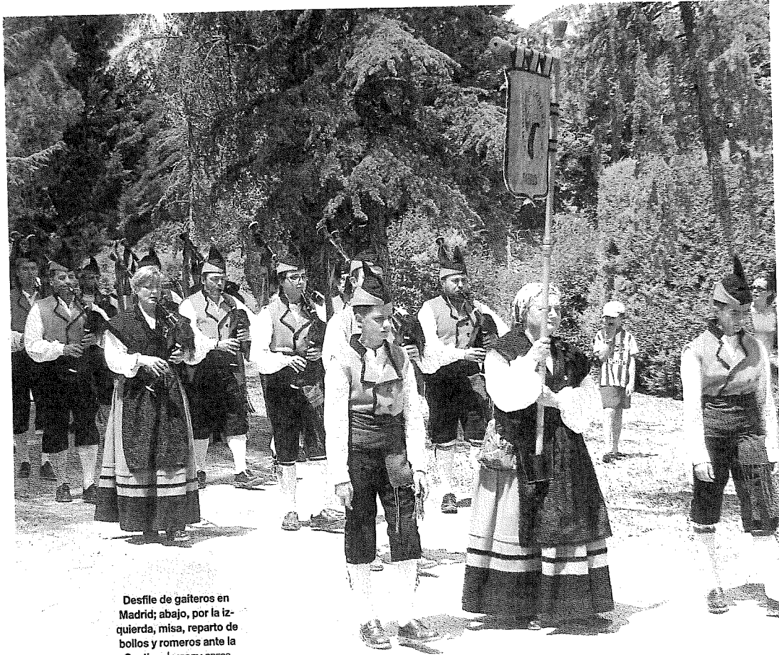
Desfile de gaiteros en Madrid; abajo, por la izquierda, misa, reparto de bollos y romeros ante la Santina.