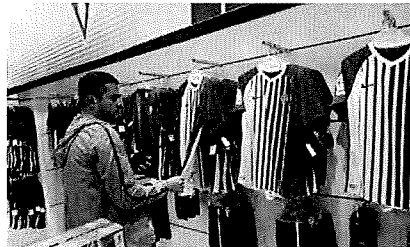
Un aficionado observa los nuevos modelos en la tienda oficial del club.