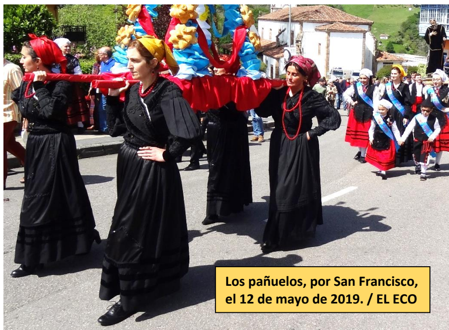
Los pañuelos, por San Francisco, el 12 de mayo de 2019.