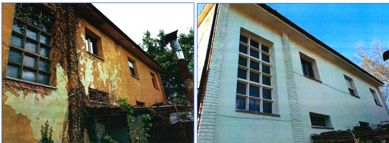
PANDENES. Antes y después de la intervención en la fachada posterior de su edificio escolar.

Esos objetivos se centraron en la mejora integral de edificios públicos, en concreto el Museo de la Escuela Rural de Asturias (en Viñón) y los edificios escolares de Santa Eulalia, Madiedo y Pandenes, más el lavadero de Casa del Río (éste, como complemento final, en el marco de una demostración práctica sobre arreglo de cubiertas. Durante y después, en fotos de la página anterior ).