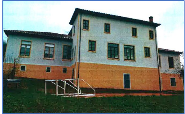
Edificios escolares de Madiedo (arriba) y de Santa Eulalia (sobre estas líneas), antes y después de su rehabilitación.

en la zona del zócalo se realizó con una base de pliolite que le confiere una elevada resistencia a la intemperie. Dos manos de pintura plástica anti-moho de color blanco que, en zonas de molduras, alero y zócalo, son de color ocre de la época para cumplir con las especificaciones del Catálogo Urbanístico. Al respecto de lo cual se ha dispuesto previamente de todos los elementos auxiliares necesarios, es decir: Andamio perimetral, redes de protección..., que permitieron el trabajo con todas las medidas de seguridad y salud, dotando al personal de herramientas, así como señalización de viales y ropa de trabajo de alta visibilidad por su proximidad a la carretera y de equipos de protección individual como guantes, casco, calzado de seguridad, arnés de seguridad, etcétera. ■