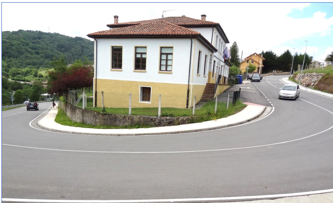
La nueva curva y área de la escuela, en la que se prevé instalar un paso de cebra y reductores de velocidad.