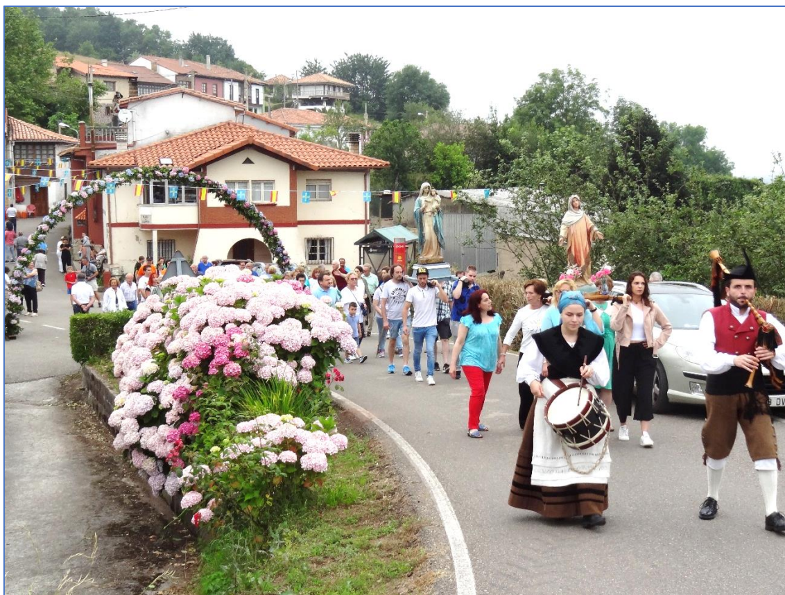
Imagen del 13 de julio de 2019.