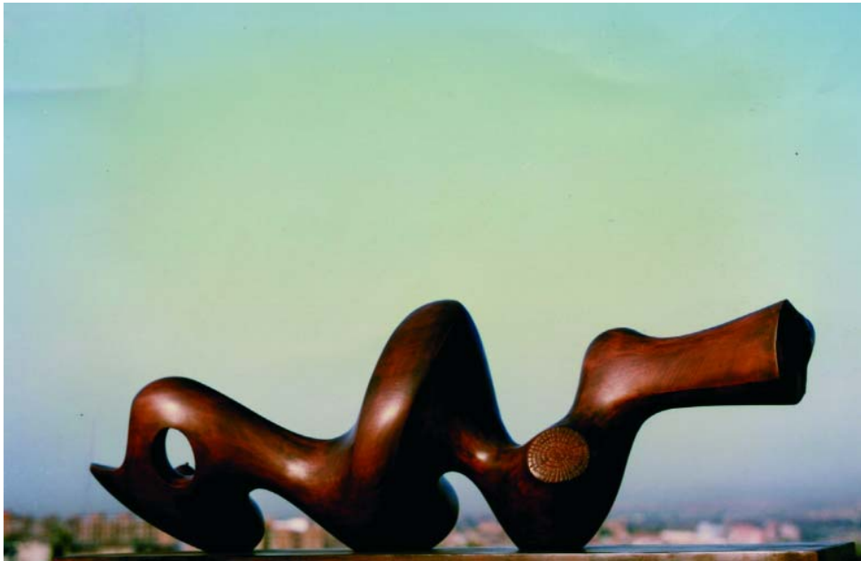
F.526 "Serie germinaciones" 1996 Madera (122x32x45 cm)