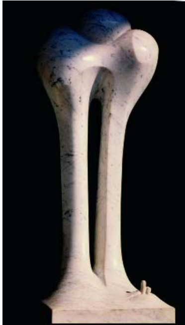
F.538 "Serie Osamentas" 1996 Mármol (70x23x23 cm)