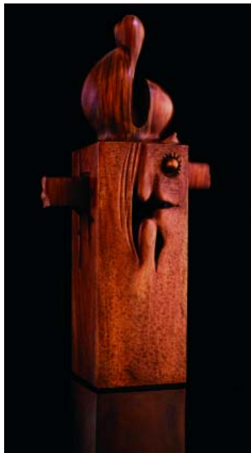
F.547 "Serie germinaciones" 1996 Madera (120x80x60 cm)