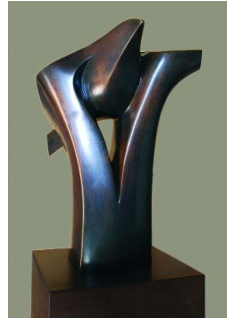
F.505 "Paloma" 1993 Bronce (55x44x42 cm)