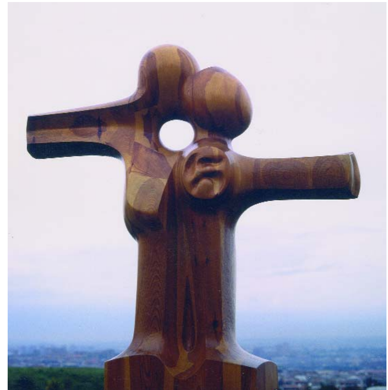
F.285 "Serie Encuentros" 1984 Madera (240x250x50 cm)