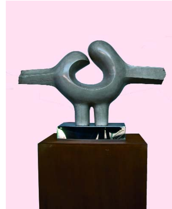
F.308 "Serie encuentros" 1985 Mármol (157x45x67 cm)