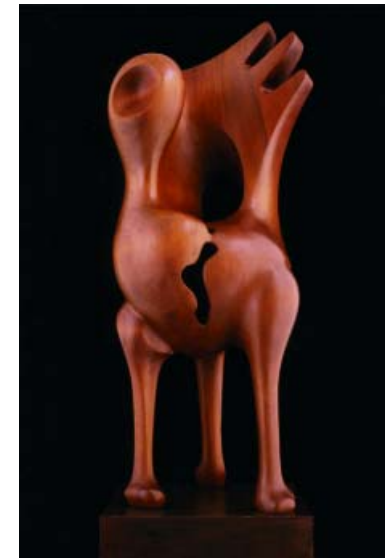
F.539 "Serie gallinetas" 1996 Madera (118x41x41 cm)