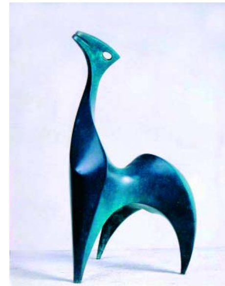
F.555 "Trinosaurio" 1998 Bronce (57x28x30 cm)