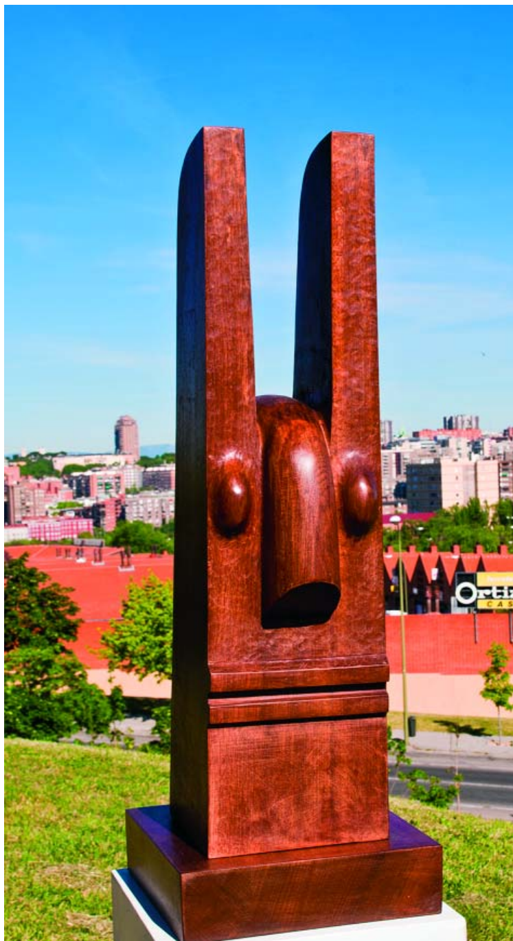
F.765 "Serie Tótems" 2014 Madera (80x30x30 cm)