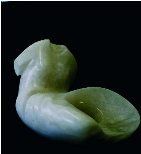
F.583 "Serie Torsos" 2000 Alabastro (40x23x25cm)