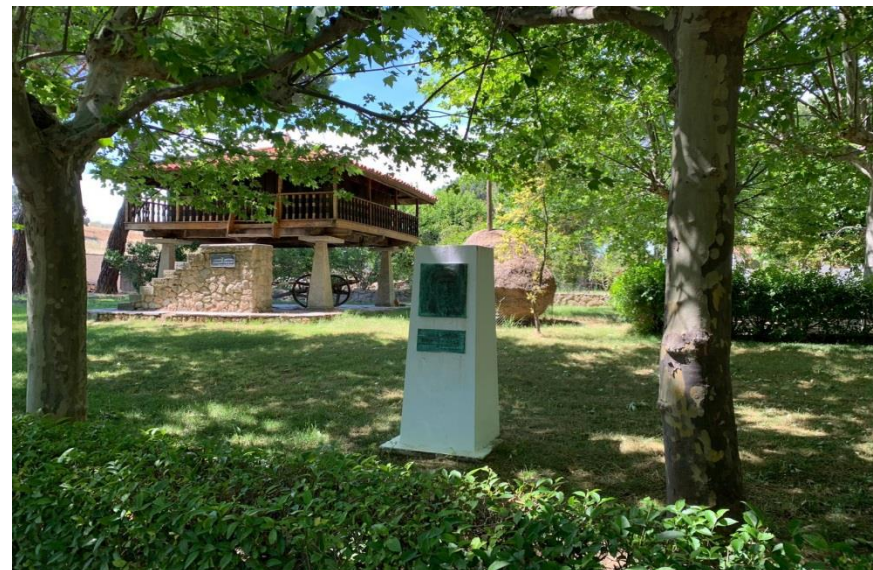
Imágenes de la Quinta “Asturias”