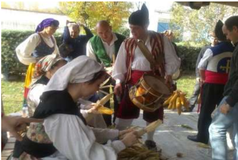
Maguestu y esfoyaza en la Quinta Asturias.