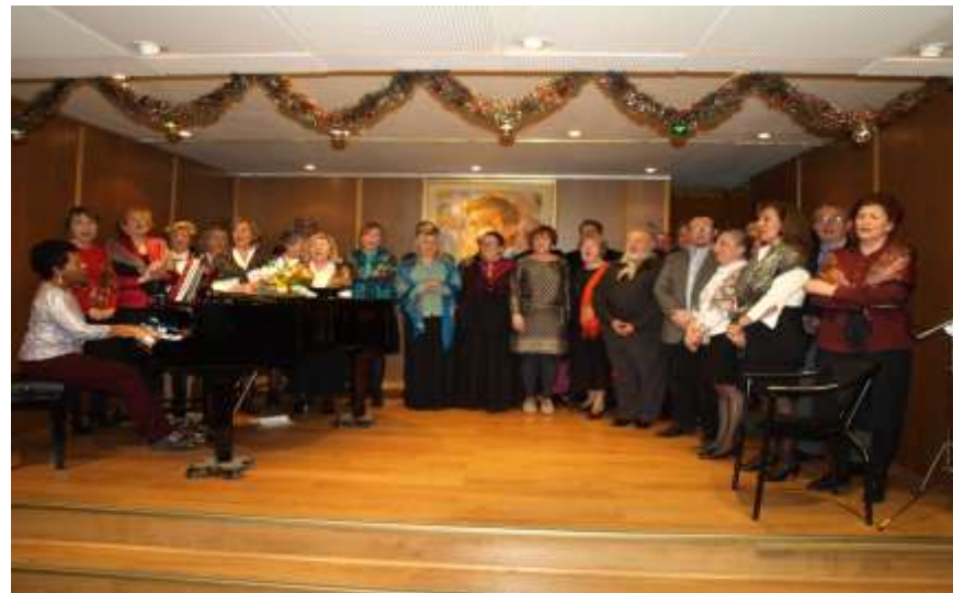
El Coro “Ecos” durante su intervención en el homenaje a Vital Aza