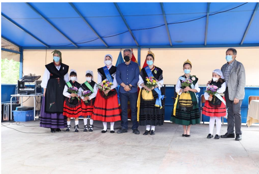
Entrañable proclamación de Xana y Xaninas 2021 en la Quinta “Asturias”