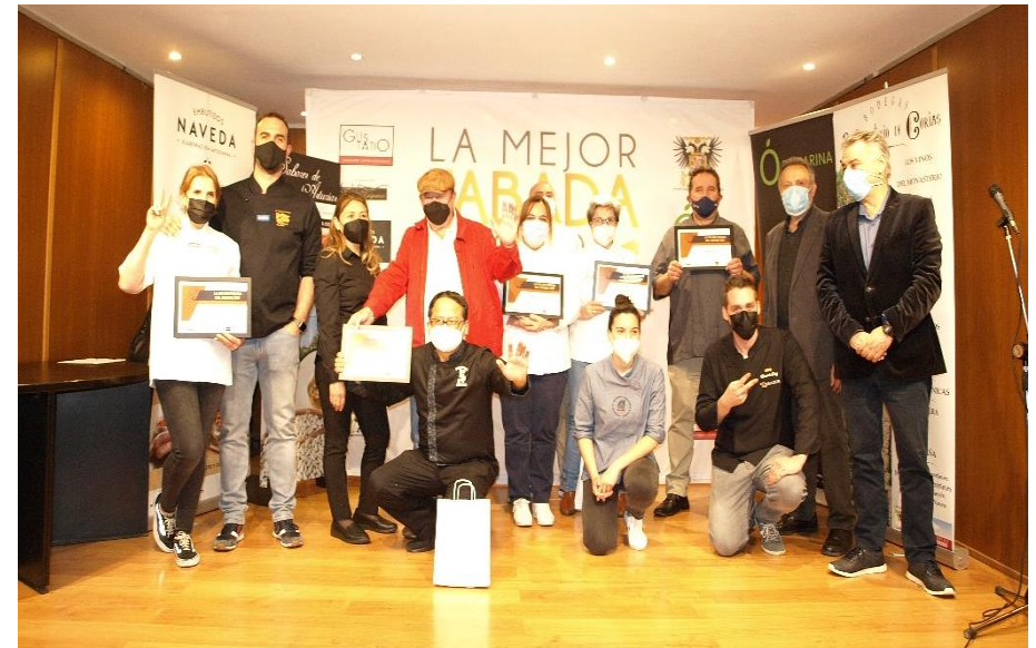
Los galardonados junto con otras personalidades

Lunes 10. Semifinal del Concurso “La Mejor Fabada del Mundo”. Degustación, reunión del Jurado y proclamación del fallo.