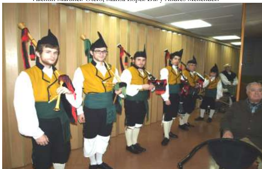
Componentes de la Banda de Gaitas del Centro Asturiano de Madrid, en una de sus actuaciones con motivo de las Jornadas de Belmonte de Miranda.