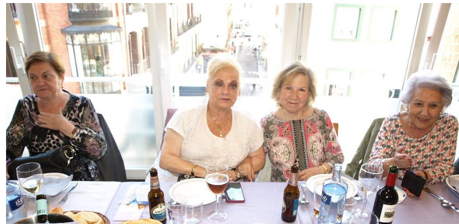
Imagen de algunas felechinas durante la comida