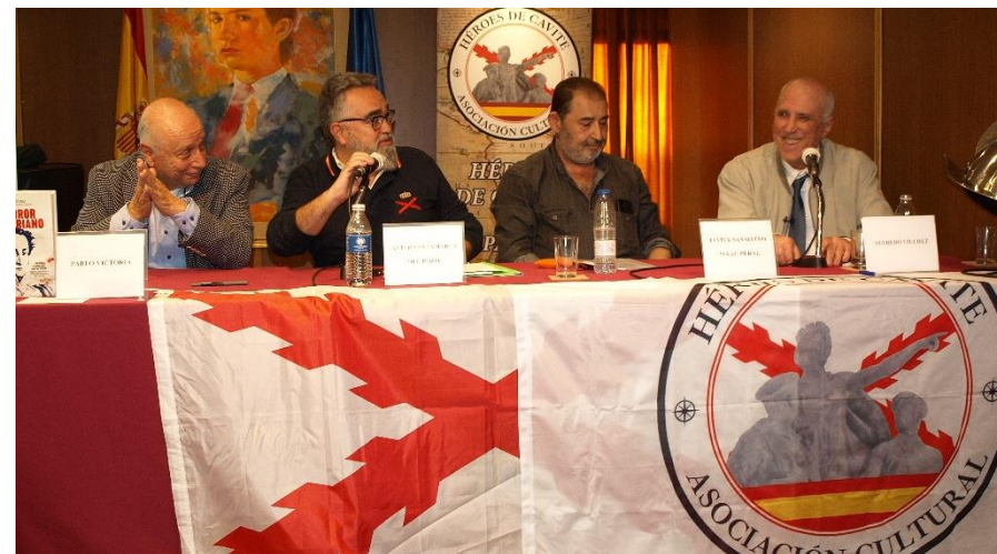
Presentación de la Asociación Cultural Héroes de Cavite

Sábado 14. Presentación de la “Asociación Cultural Héroes de Cavite en Madrid”. A continuación, Mesa Redonda con el título “Hispanidad y Leyenda Negra”.