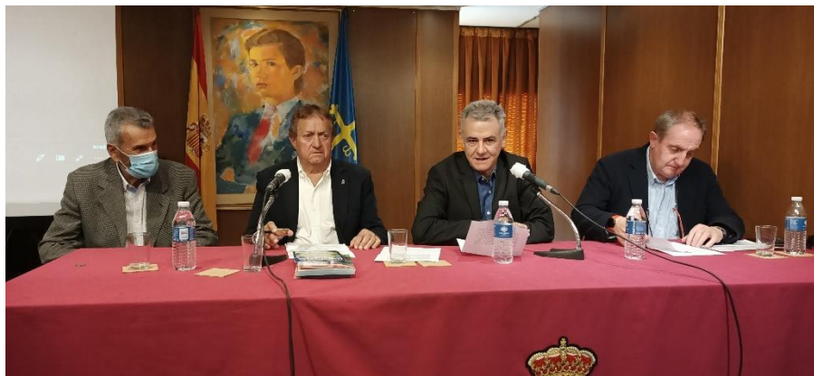
En la imagen mesa de ponentes de la Fiesta del Asturcón

El pasado día 25 de mayo, se presentó en el Salón Príncipe de Asturias del Centro Asturiano de Madrid, la XLII edición de la Fiesta del Asturcón, declarada Fiesta de Interés Turístico Nacional, que se celebrará en la majada de Espineras, en el Puertu del Sueve, el próximo 20 de agosto, organizada por ACAS (Asociación Conservadora de Asturcones del Sueve).