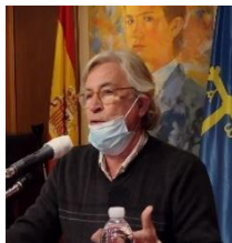
Manuel García Estadella Poeta asturiano