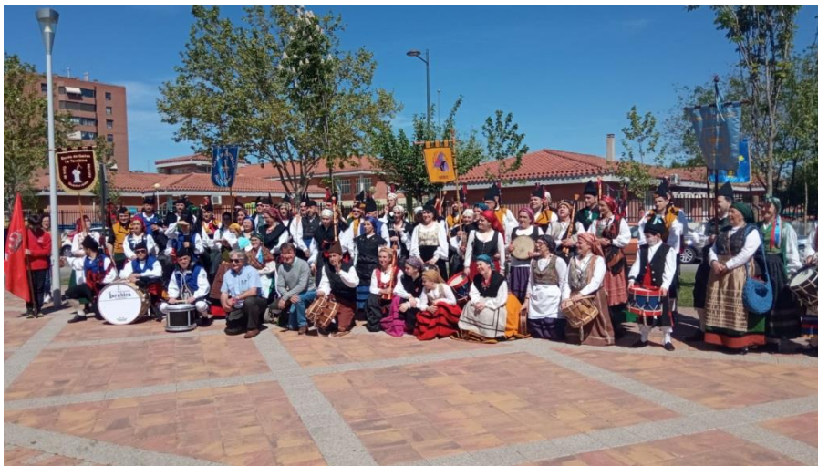
Participantes en la Xuntanza posan al finalizar la actuación

El pasado sábado 7 de mayo, el Centro Asturiano de Tres Cantos celebró en esta localidad madrileña la esperada Xuntanza de agrupaciones, en la que participaron los grupos folclóricos de los Centros Asturianos y Casas de Asturias de la Comunidad de Madrid (Alcalá de Henares, Alcobendas, Guadarrama, Tres Cantos y Madrid).