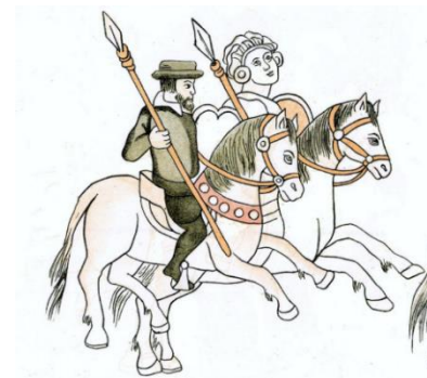
Possible retrato de María de Estrada en el Lienzo de Tlaxcala

Tampoco se sabe cuándo viaja a América, pero muy probablemente lo haga con su hermano Francisco en 1509. Como quiera que sea, casa en Cuba con Pedro Sánchez Farfán, y posiblemente, hasta es capturada por un cacique local, que, muy probablemente, la tomaría para sí, convirtiendo a María en una de las primeras españolas en unirse carnalmente a un indígena americano. Quede claro, una de las primeras “mujeres” españolas, porque “hombres” españoles ya lo habían hecho para entonces en reiteradas ocasiones, y no sólo extramatrimonialmente, sino incluso casándose.