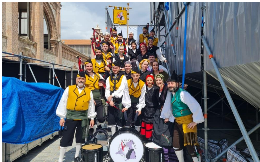
La Banda de Gaitas y la Agrupación Folclórica en San Isidro

Sábado 14. Actuación de la Agrupación Folclórica “L’Alborá” y de la Banda de Gaitas “El Centru”, con motivo de San Isidro.