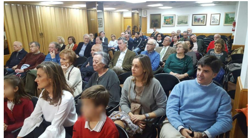
Vista parcial del público asistente

Muchas gracias a todos y muchas gracias por la invitación para estar hoy aquí con ustedes.