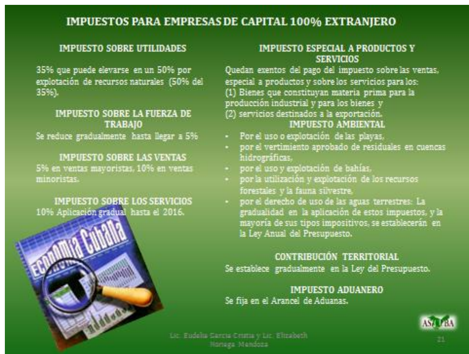
Tabla sobre impuestos para empresas con capital 100% extranjero