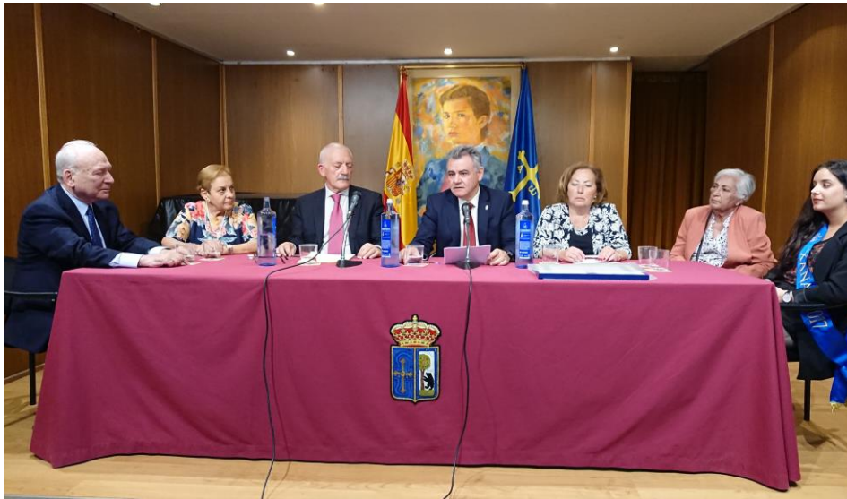
En la imagen, la mesa presidencial

mayor de los éxitos a una Institución comprometida con la cultura asturiana y con su difusión por el mundo. Muchas gracias.