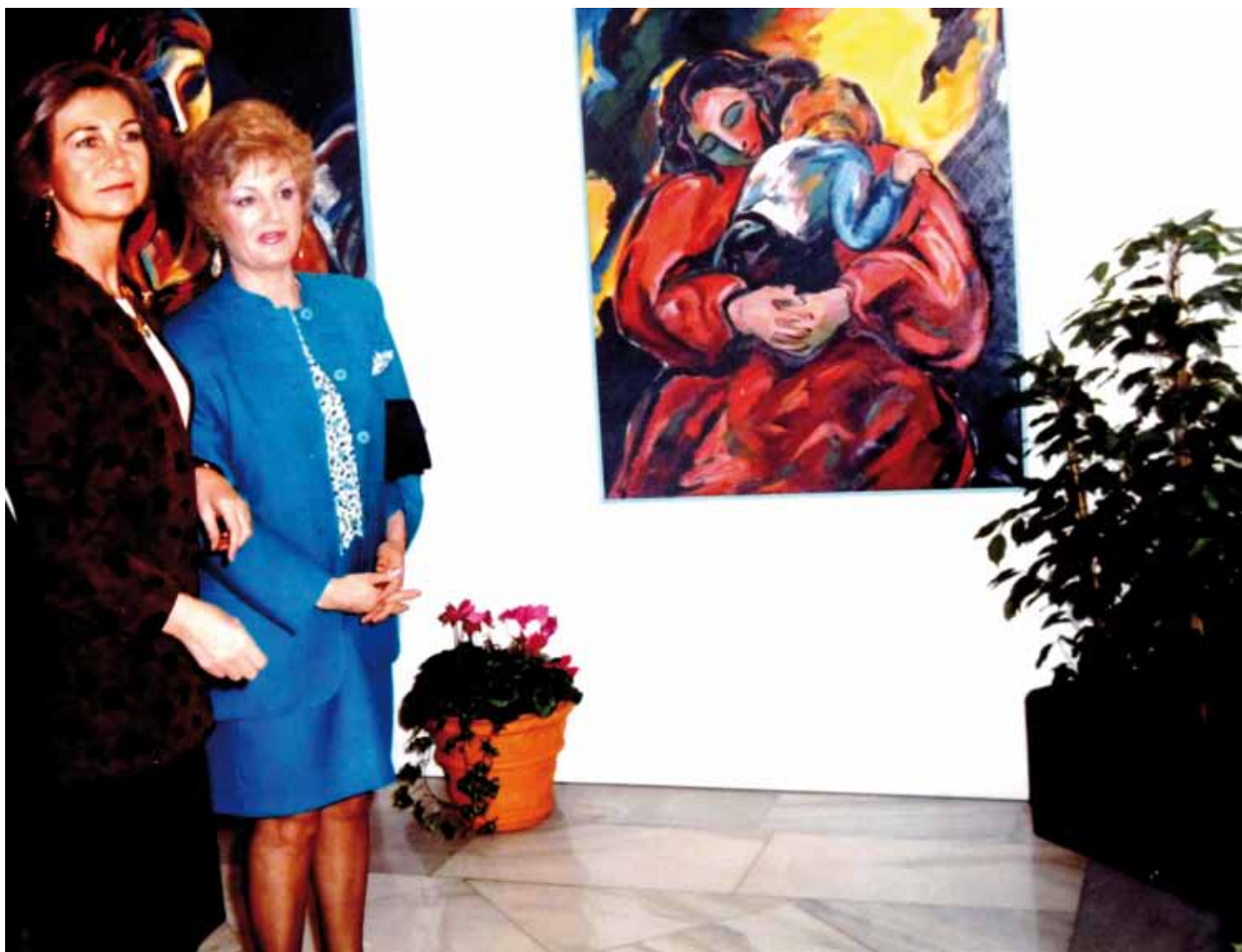
Exposición en Tabacalera, inaugurada por S.M. la Reina, 1991