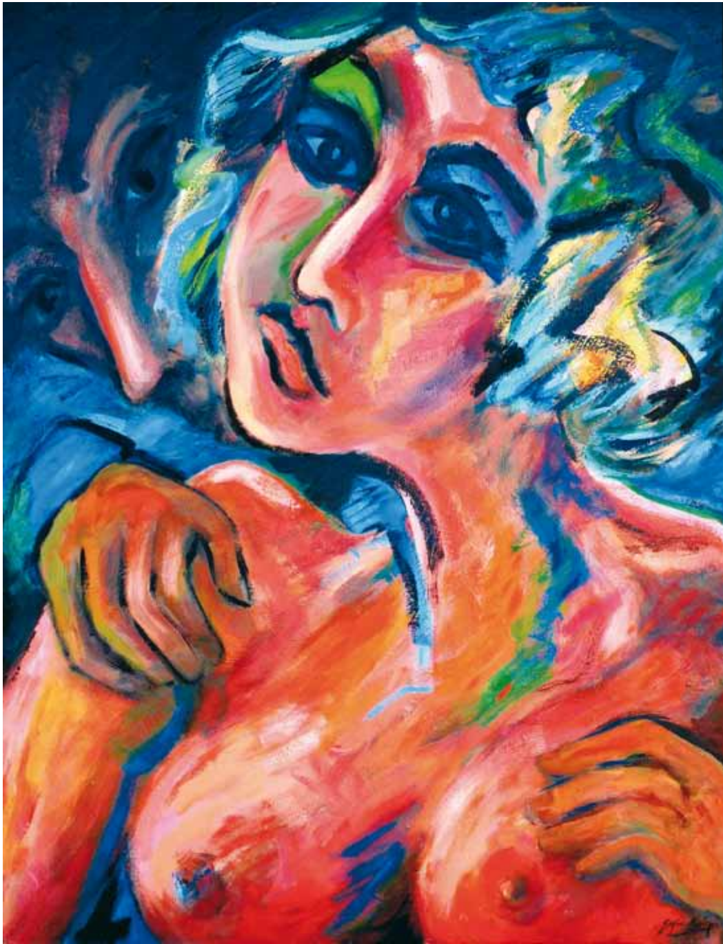
Amantes ● Óleo sobre lienzo ● 100x81 ● 1988