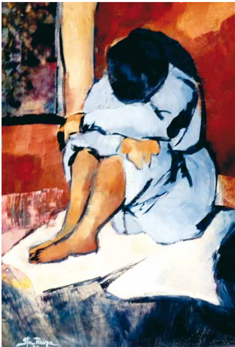
Marginación ● Óleo sobre tabla ● 34x24 ● 1977