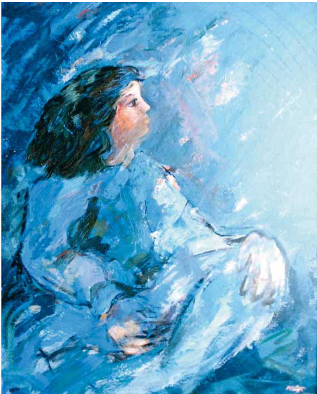
Niña en azul ● Técnica mixta ● 125x100