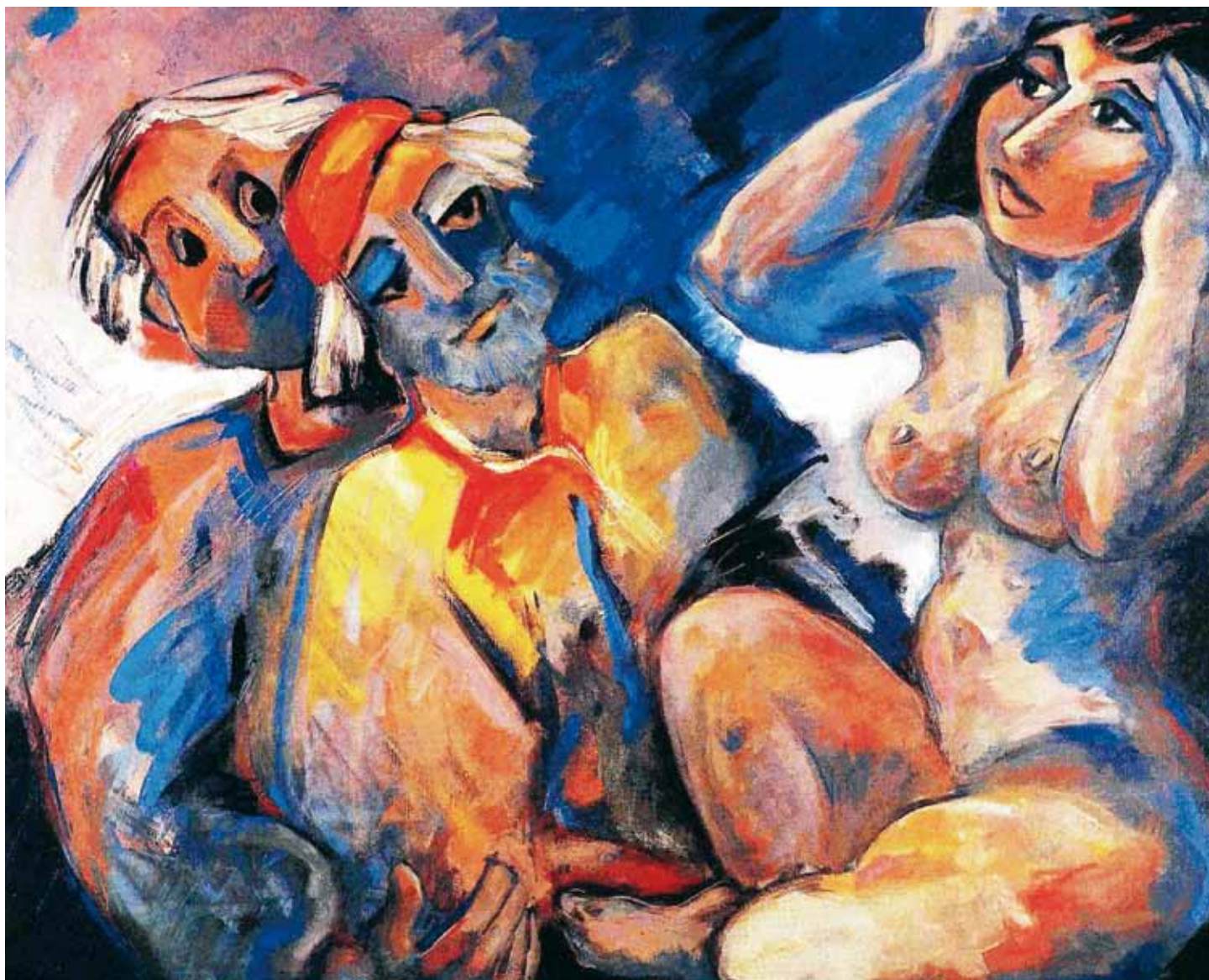
Susana y los viejos • Óleo sobre lienzo • 100x81 • 1987