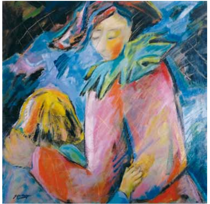
Día para el olvido ● Óleo sobre lienzo ● 70x70 ● 2004