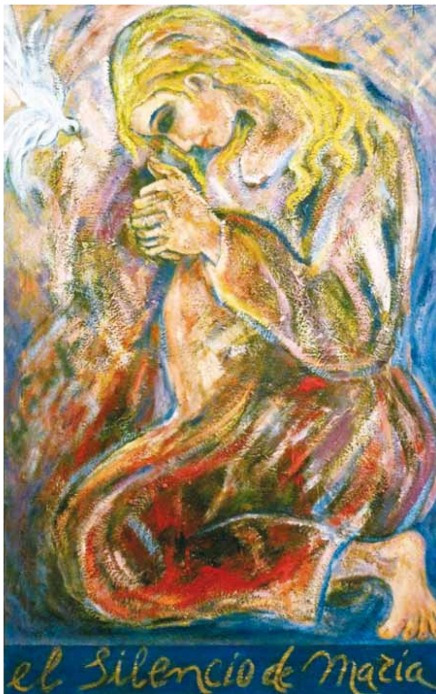
El silencio de María ● Óleo sobre lienzo ● 116x73 ● 2000