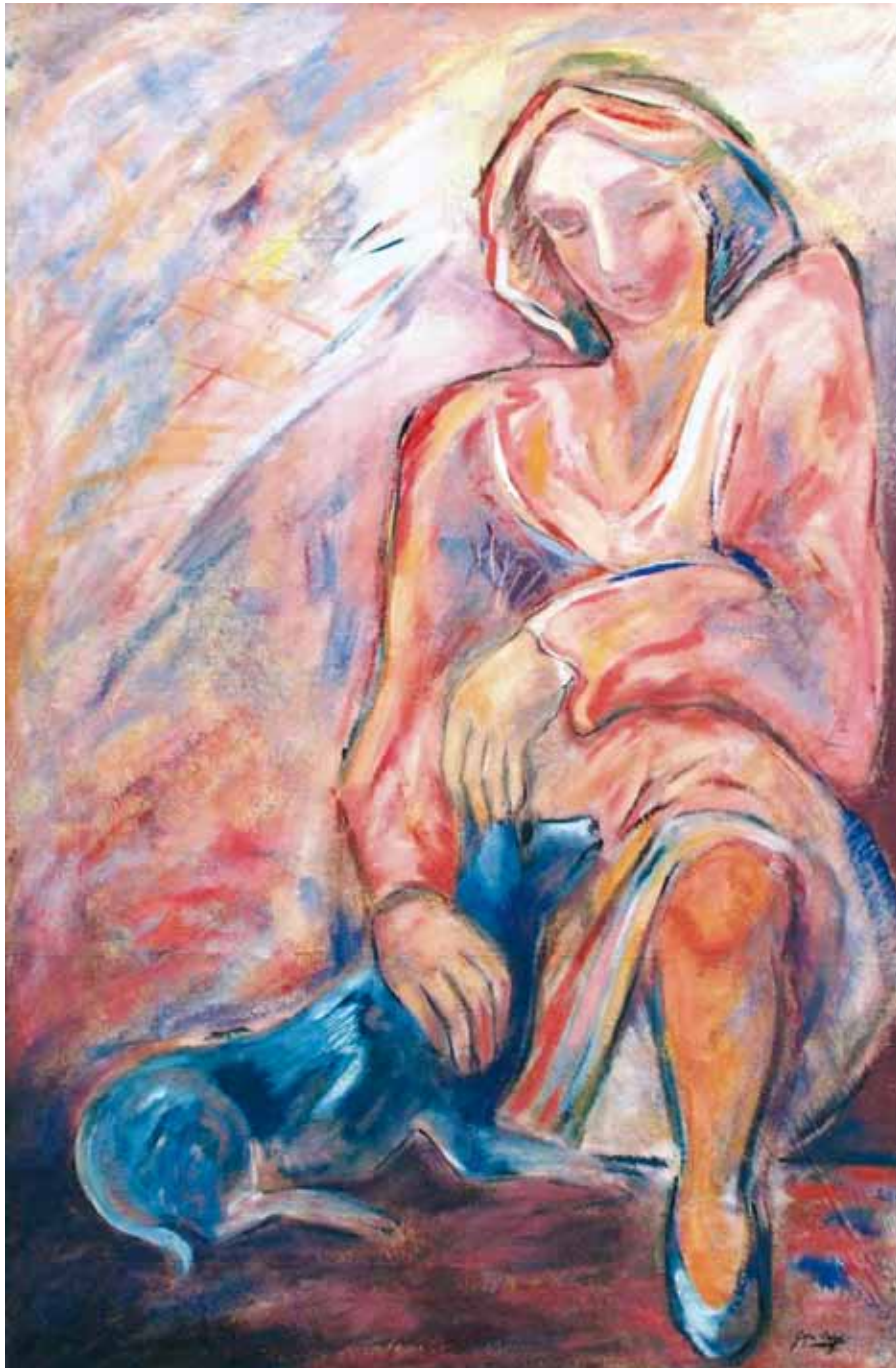
¡Qué paz cuando en la tarde misteriosa! ● Óleo sobre lienzo ● 150x100 ● 1991