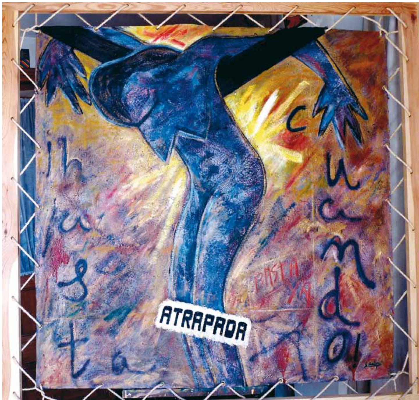
Atrapada • Óleo sobre lino • 150x150 • Contra la violencia de género , 2009