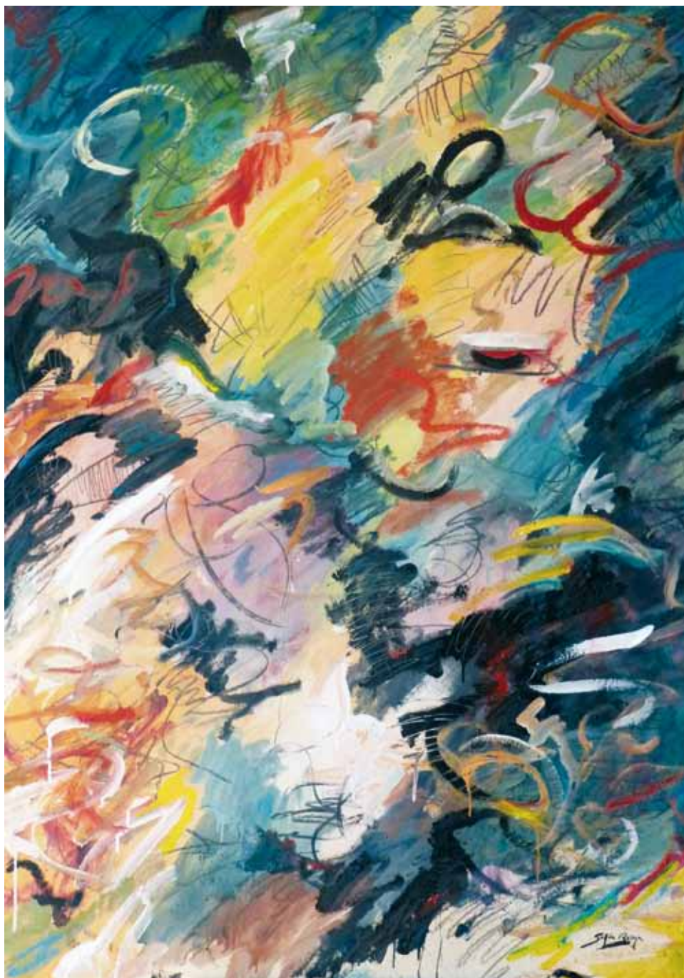
Sinfonía de color ● Técnica mixta ● 140x100 ● 2017