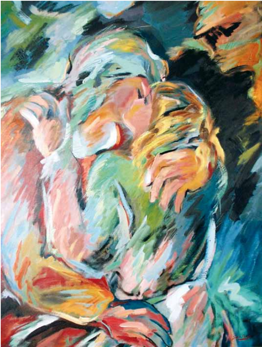
¡Qué blanco tu corazón! ● Óleo sobre lienzo ● 130x100 ● 1998