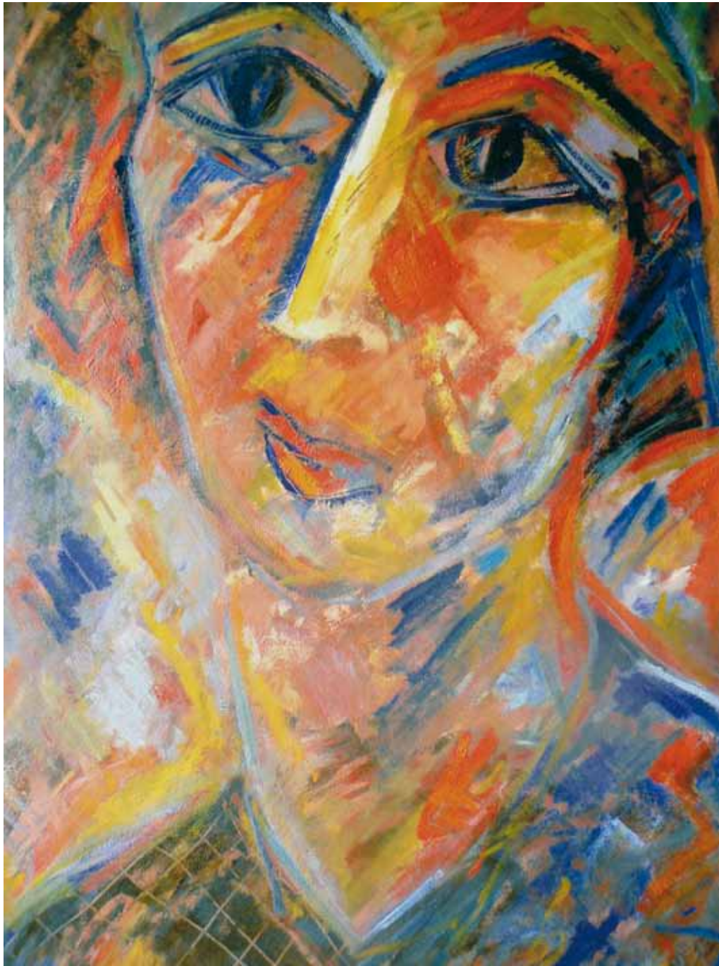
El alma es como un libro no leído ● Óleo sobre lienzo ● 50x100 ● 2009