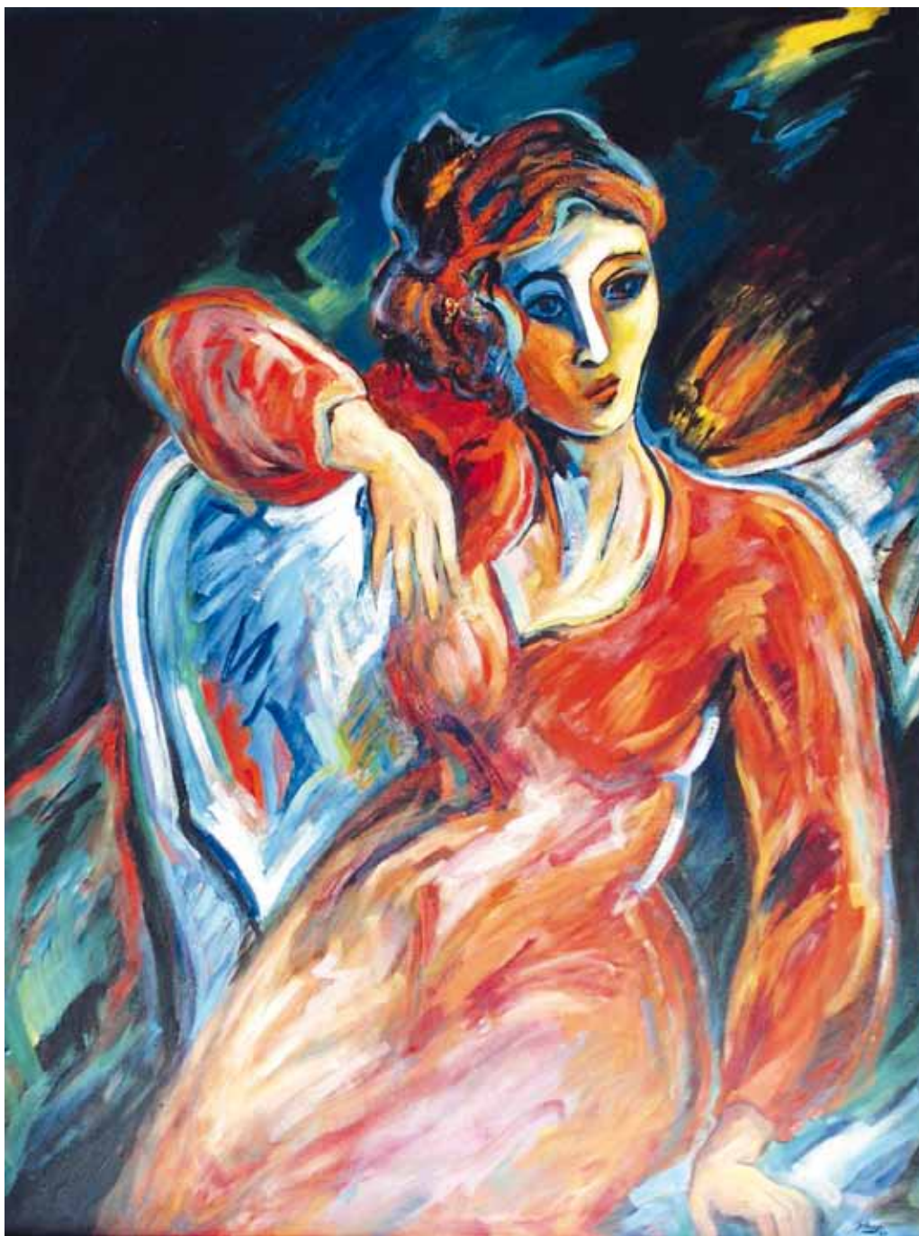
Dulzura de su claro sol poniente ● Óleo sobre lienzo ● 200x150 ● 1988