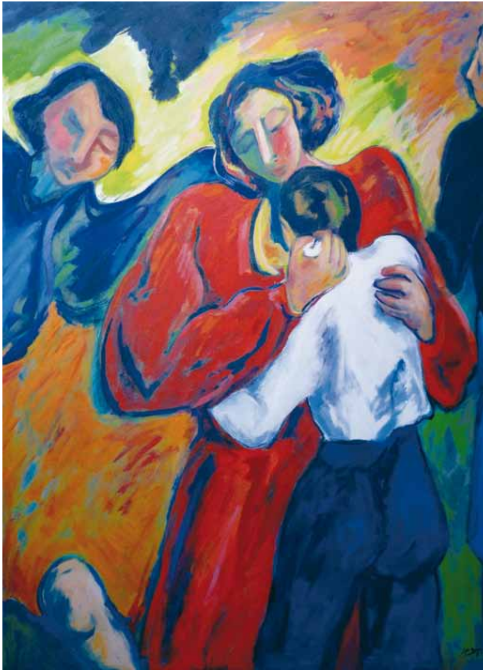
Estás dentro de mí ● Óleo sobre lienzo ● 190x140 ● 1990