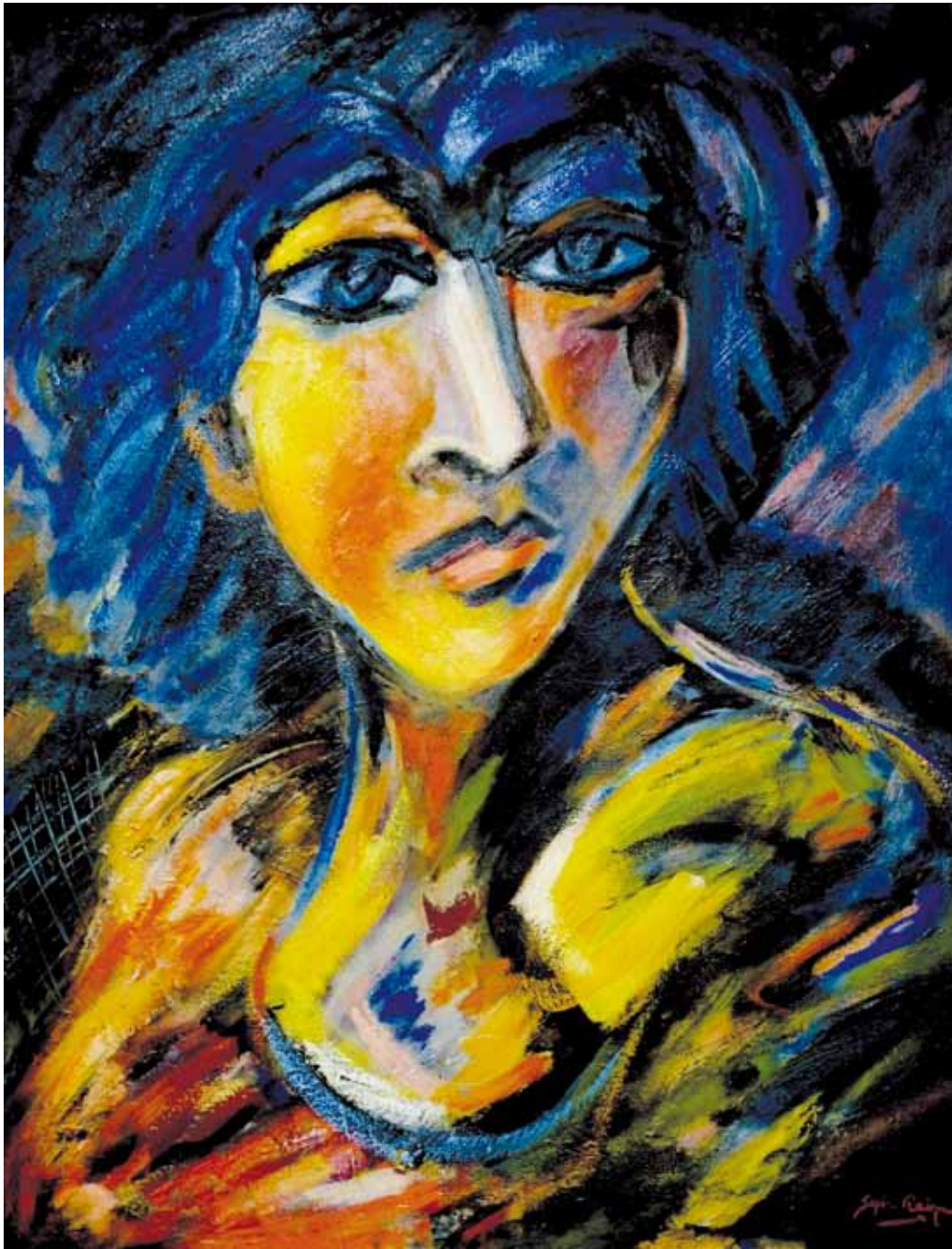
Marta ● Óleo sobre lienzo ● 100x81 ● 1988 ● (Colección Casa de Cultura de Almadén, Ciudad Real)