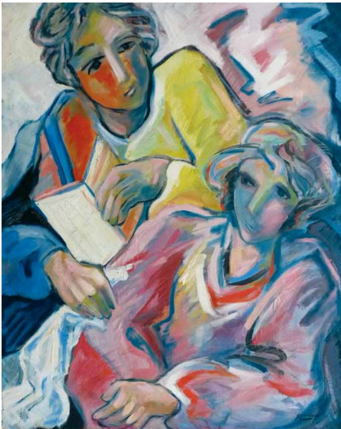
Rosa de los caminos interiores ● Óleo sobre lienzo ● 130x100 ● 1990