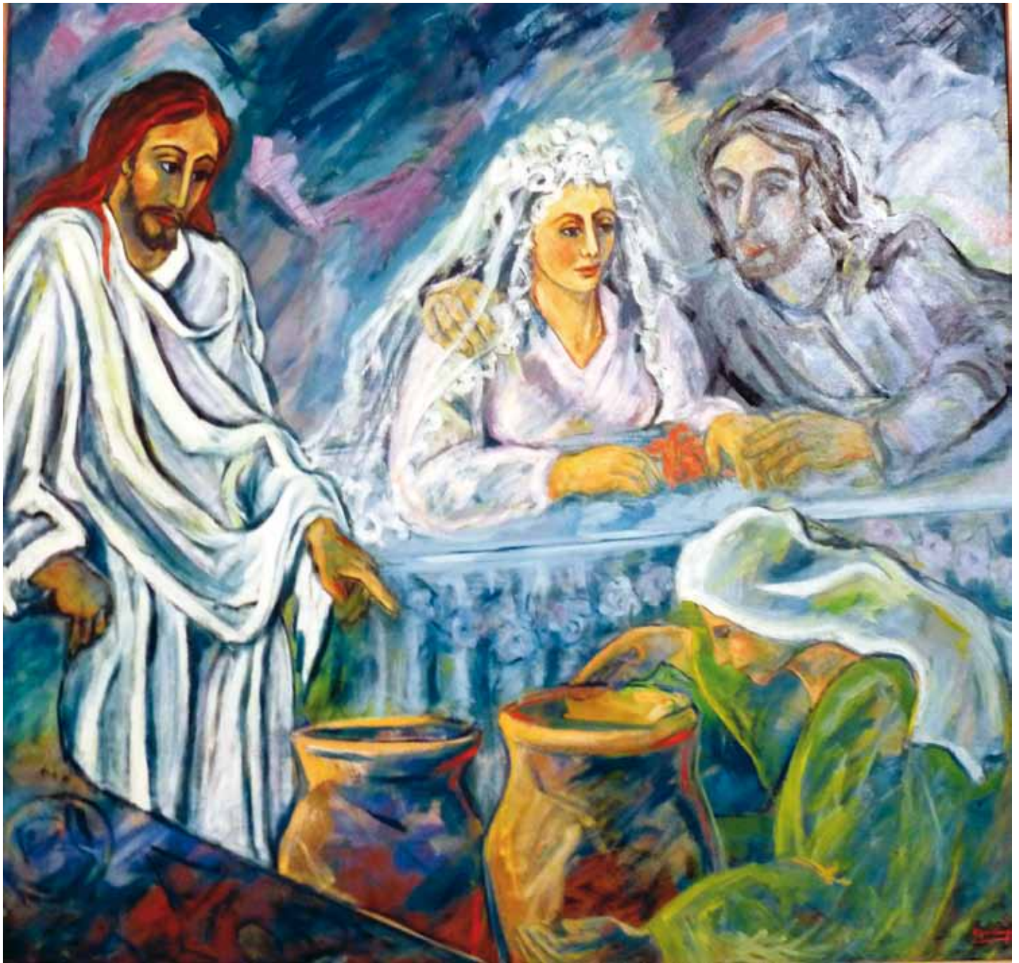
Mujer, ¿y a nosotros qué nos va? ● Óleo sobre lienzo ● 150x150 ● 2000