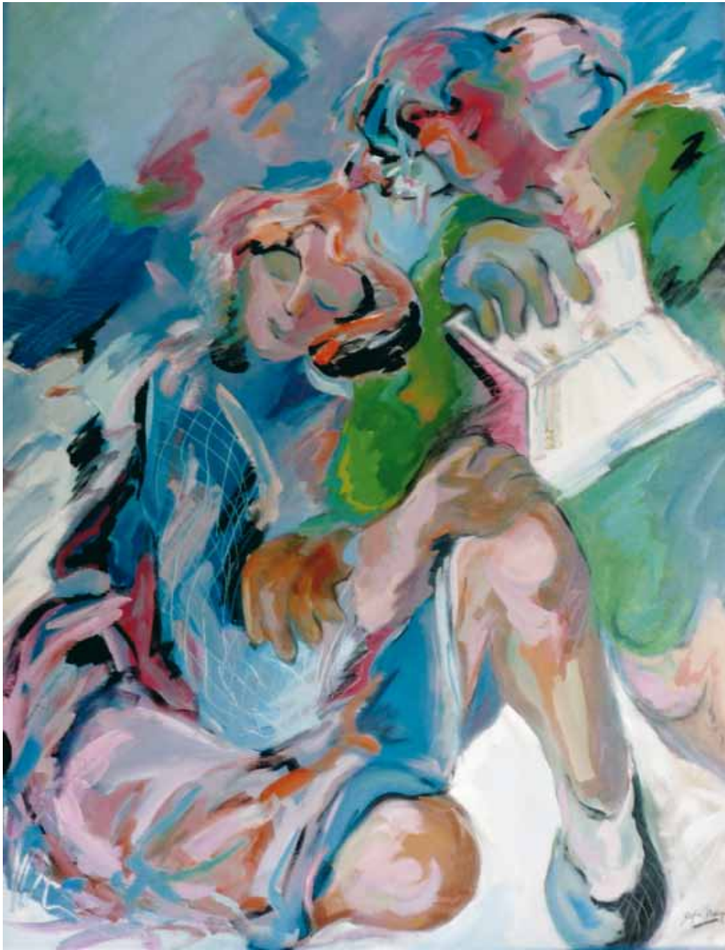
Más aunque abril no te abra a ti tus flores ● Técnica mixta ● 130x100 ● 1989