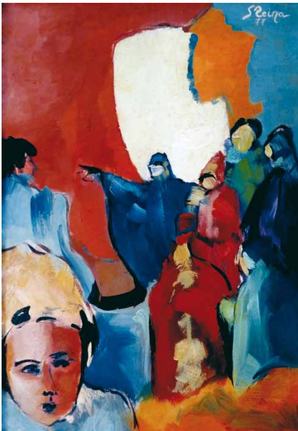
Inocente ● Óleo sobre tabla ● 35x25 ● 1977