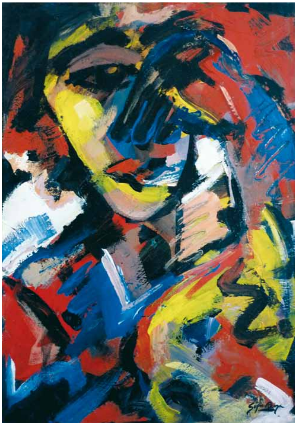
Tristeza ● Técnica mixta ● 50x35 ● 2009