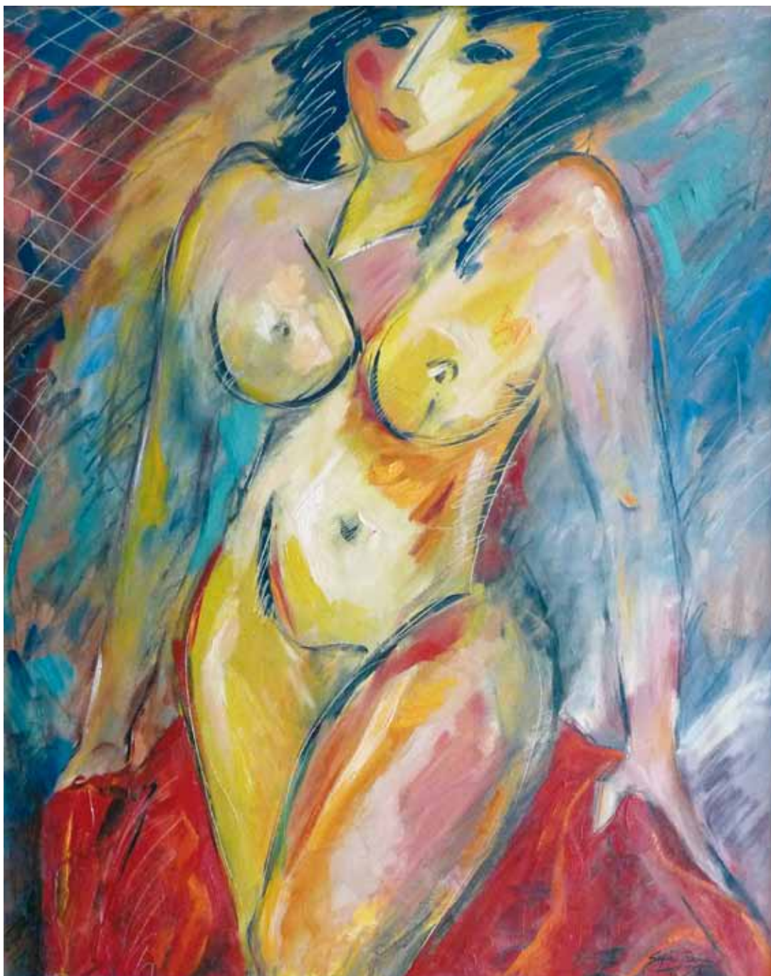
Tan cerca y tan distante ● Óleo sobre lienzo ● 100x81 ● 1992