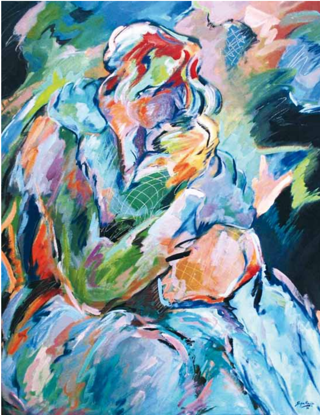
Junto a ti se paró la primavera ● Óleo sobre lienzo ● 130x100 ● 1989