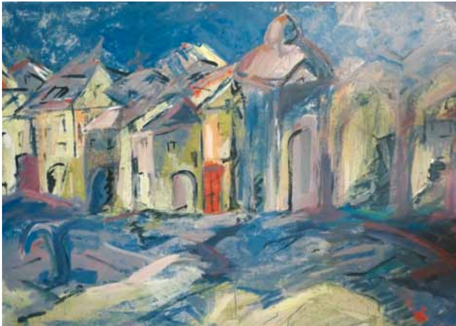
18 Arriba: Confidencias ● Óleo sobre lienzo ● 81x60 ● 1998 Abajo: Paisaje de Dulcinea ● Técnica mixta ● 140x90 ● Finalista en Valdepeñas, 1988