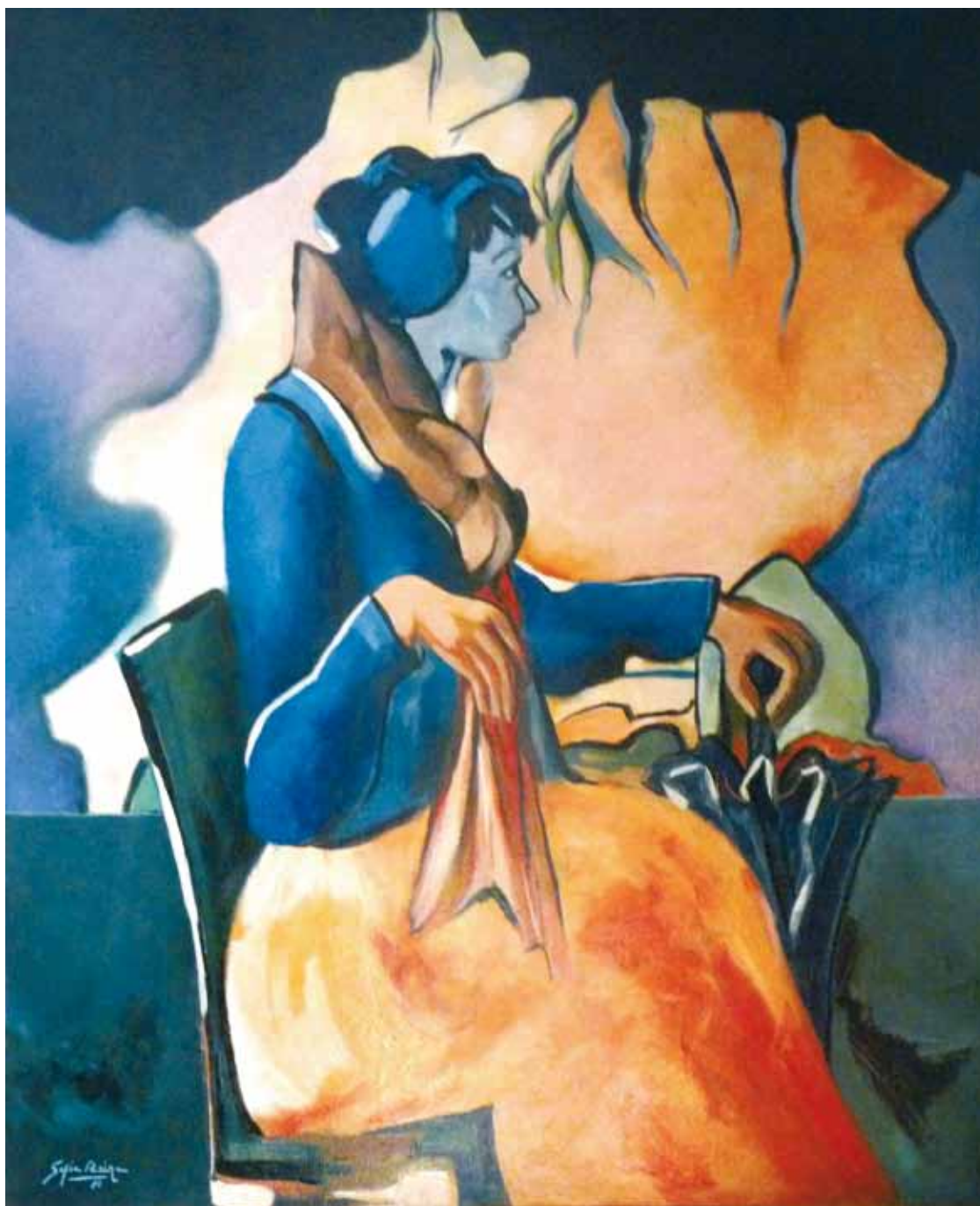
La dama que perdió el tren del deseo ● Óleo sobre lienzo ● 100x81 ● 1980