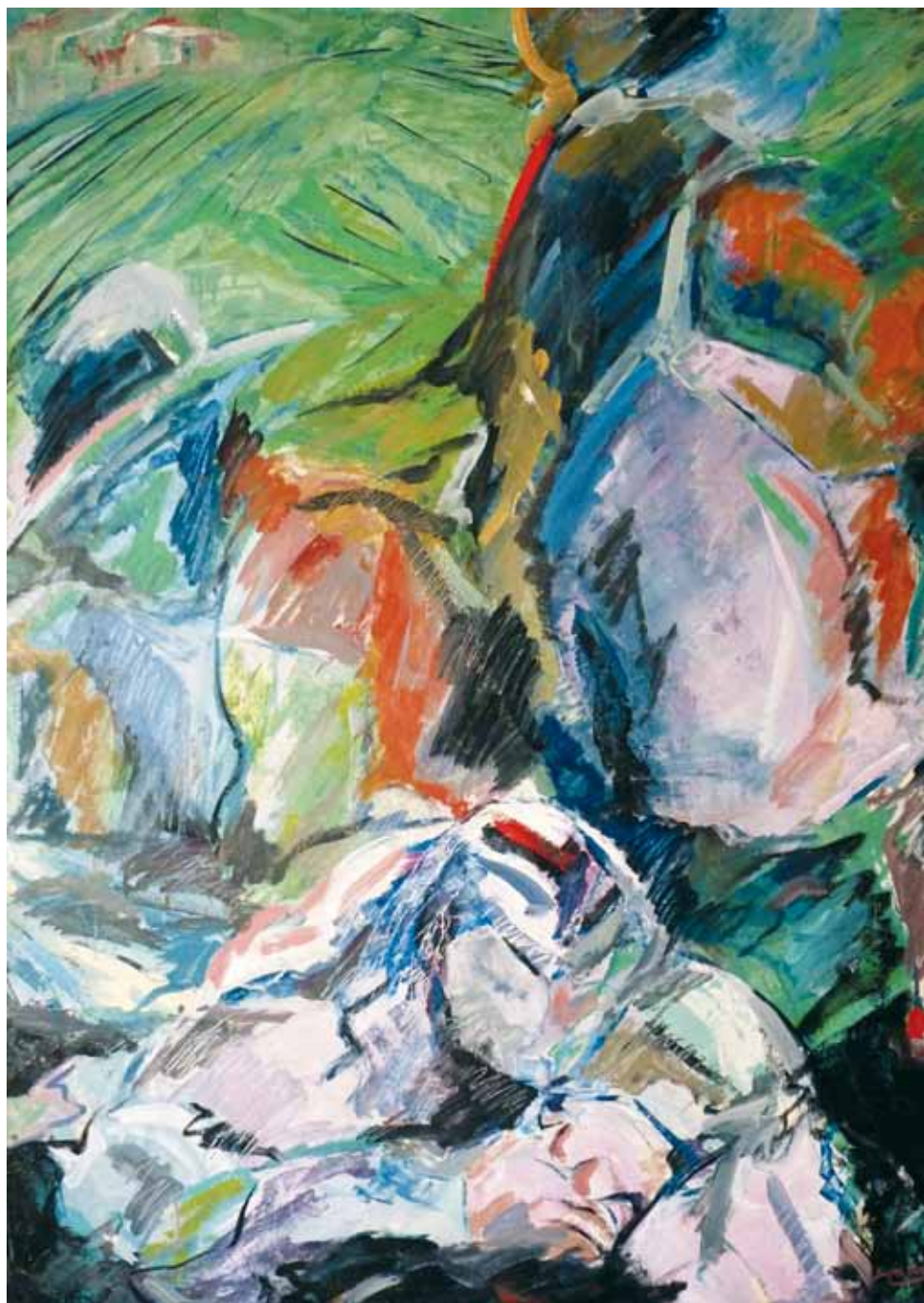
Tarde de pic-nic ● Técnica mixta ● 130x92 ● 1989