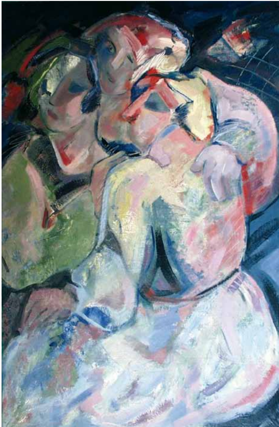
Tres generaciones ● Óleo sobre lienzo ● 130x100 ● 2009