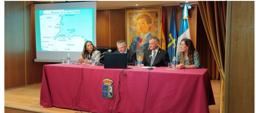
El Ministro Consejero durante su intervención

La región estaba habitada por los pueblos itzaes cuando fue descubierta por Hernán Cortés, en 1525, cuya capital era Tayasal. Después de muchos y sanguinarios intentos de las tropas españolas por conquistar a los itzaes, en 1618 los misioneros franciscanos lograron entrar de manera pacífica denominándolo Nojpetén (hoy, isla de Flores). Fue hasta en 1697 cuando las tropas españolas lograron instalar su primer asentamiento en la región, que era parte del corregimiento de las Verapaces. En 1866, el presidente Vicente Cerna creó el departamento de El Petén.