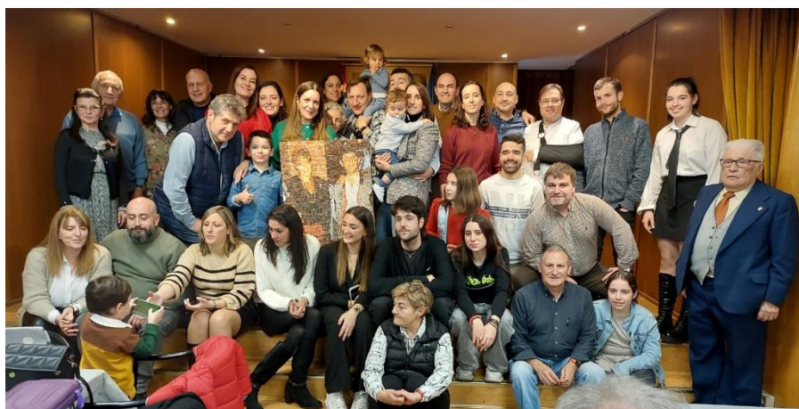
Algunos de los asistentes a la comida posando al final de la misma

Se celebró el sábado 28 de enero la tradicional comida de las Agrupaciones del Centro Asturiano de Madrid, para muchos de sus miembros, uno de los eventos del año. Como siempre, es la gran oportunidad de poder reencontrarse después de las fiestas navideñas y por qué no, hacer balance del último año y plantearse nuevos horizontes para el 2023.