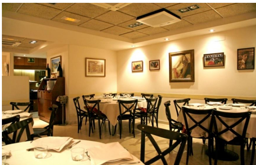
Casa Hortensia – Restaurante ESPECIALIZADO EN COMIDA ASTURIANA C/ Farmacia, 2 Plantas 2ª y 3ª (28004 Madrid) Telfs : +34 915 390 090 – 91 522 42 18 – 91 531 37 24 E-mail: restaurante@casahortensia.com http://www.casahortensia.com