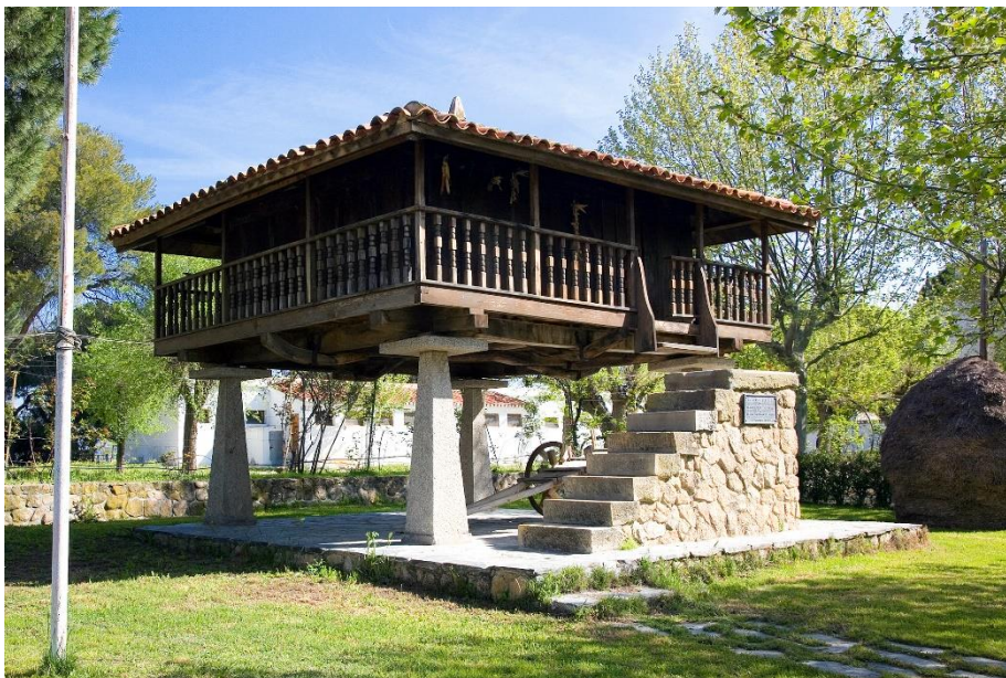
Disfruta de la primavera en la Quinta "Asturias"