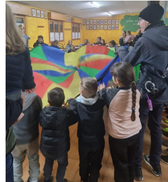
Niños jugando durante la fiesta

Sábado 7. Quinta “Asturias”. Fiesta Infantil de Reyes.