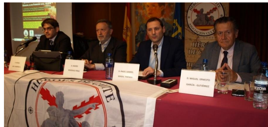
Acto organizado por Héroes de Cavite

Sábado 25. I Jornada de la Hispanidad y la Leyenda Negra. Organizada por la Asociación Héroes de Cavite (Delegación de Madrid)