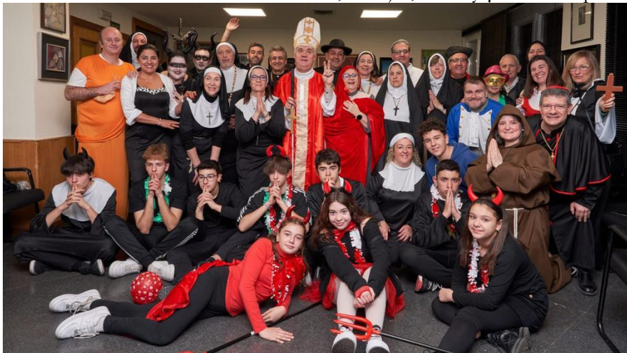
Foto de algunos de los participantes

En esta edición se mezclaron diablillos, monjas, curas y ¡hasta el Papa!