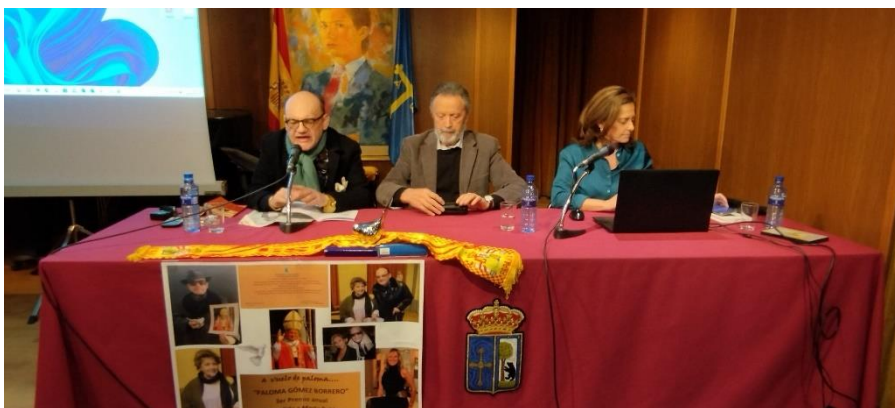
Un momento de la entrega del Premio