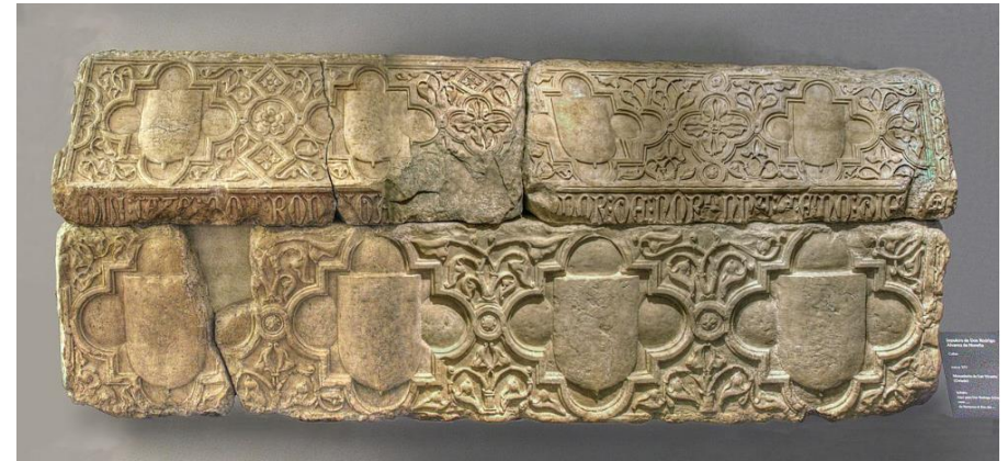
“Sepulcro de Rodrigo Álvarez de Asturias. Museo Antropológico de Oviedo.”

Que hagan Vds. mucho bien y que no reciban menos.