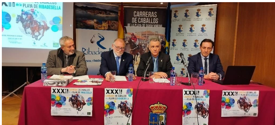
Imagen de la mesa de ponentes

Miércoles 22. Organizado por el Ayuntamiento de Ribadesella. Presentación a la prensa de las Carreras de Caballos en Semana Santa en Ribadesella.