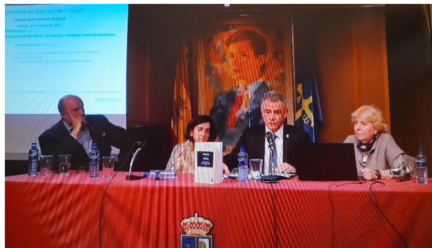
Un momento de la presentación de “Violencia y trabajo”

Complutense de Investigación: Psicosociobiología de la Violencia: educación y prevención.