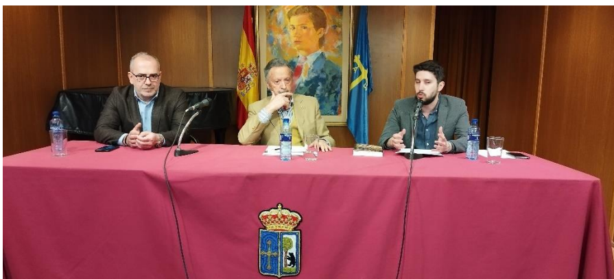
Mesa de ponentes del acto organizado por Héroes de Cavite

Y para situar a los presentes, se retrotrae a los años sesenta del siglo 14 citando la muerte en 1369 del rey de Castilla, Pedro I “el cruel”, a manos de su hermanastro Enrique, quien se autoproclama como Enrique II de Castilla, primer rey de la Casa de Tratámara. Como curiosidad, añadimos que su hijo Juan, quien reinó como Juan I de Castilla, fue el creador de la dignidad de Principado de Asturias a la par de unificar las dos líneas sucesorias a la corona de Castilla: una, la descendencia de Pedro I y otra la de Enrique II.