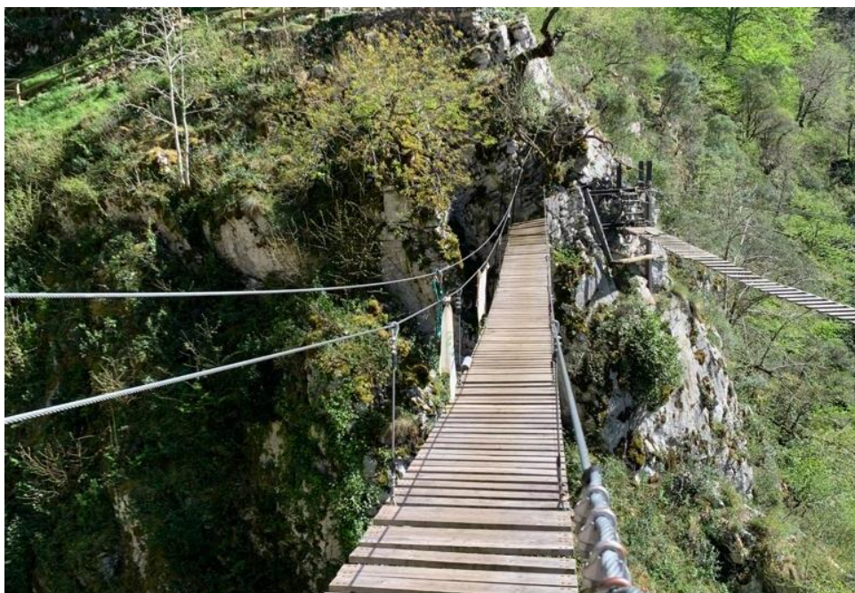
Ruta del Cares (Asturias)