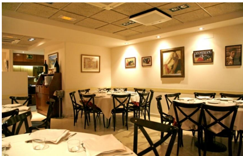
Casa Hortensia – Restaurante ESPECIALIZADO EN COMIDA ASTURIANA C/ Farmacia, 2 Plantas 2ª y 3ª (28004 Madrid) Telfs : +34 915 390 090 – 91 522 42 18 – 91 531 37 24 E-mail: restaurante@casahortensia.com http://www.casahortensia.com