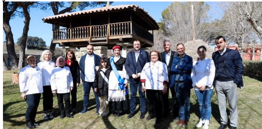
El Presidente del Principado posa junto a los Presidentes de las Casas de Madrid, las guisanderas y la Xana y Xanina del Centro Asturiano de Madrid.

Sábado 4, desde las 12 h. En la Quinta “Asturias” JORNADA DE ASTURIANÍA EN MADRID