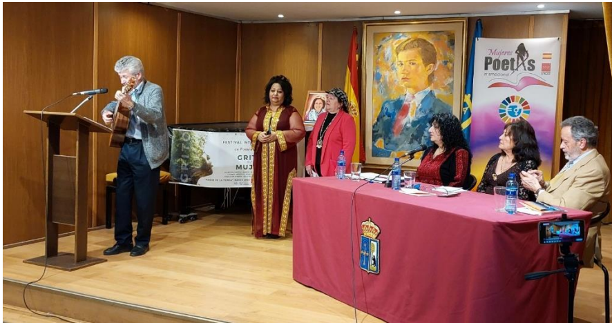
Martes de la Poesía

Martes 28. Martes de la Poesía. Tribuna abierta para rapsodas y poetas.