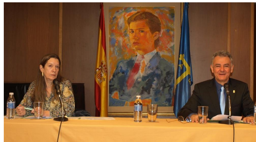
La Secretaria General y el Presidente, durante la Asamblea

Se celebró según el Orden del Día previsto.