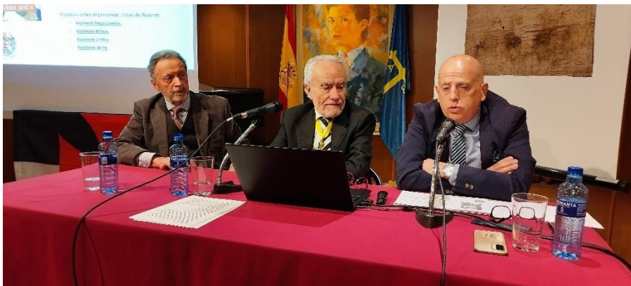
Imagen de la conferencia

Rodella, el escultor italiano más importante de lo que va de siglo, encabezó un notable equipo de científicos y técnicos de varias universidades italianas. Con los datos extraídos de la Síndone de Turín por ese equipo, realizó la escultura más fidedigna, hasta la fecha, del hombre al que se amortajó, probablemente, con la Sábana Santa. Esta escultura, expuesta en repetidas ocasiones en Universidades, Museo de los Papas en Roma, Scala Sacra del palacio papal de Letrán, etc. salió de Italia por primera y única vez y estuvo expuesta en Madrid en la Real Colegiata de San Isidro, traída por la Orden del Temple.