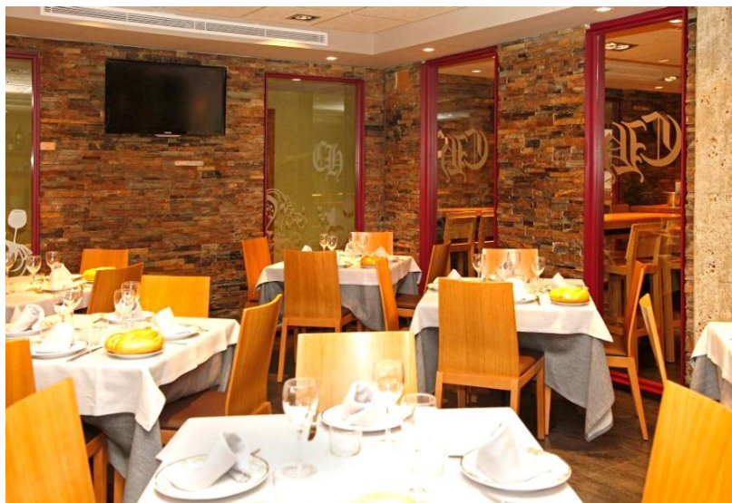
Casa Hortensia – Restaurante ESPECIALIZADO EN COMIDA ASTURIANA C/ Farmacia, 2 Plantas 2ª y 3ª (28004 Madrid) Telfs : +34 915 390 090 – 91 522 42 18 – 91 531 37 24 E-mail: restaurante@casahortensia.com http://www.casahortensia.com